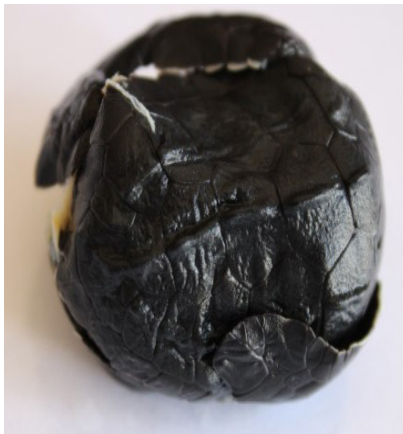
Figura 3. Embrión de L. olivacea con caparazón comprimido.

Después de los problemas en la pigmentación, las anomalías asociadas a la estructura ósea poseen un segundo lugar en cuanto a cifras registradas, donde destacan problemas como: caparazón comprimido y deformación de los huesos (Figura 3); esto, con valores de 115 y 49 casos en el vivero Ulises en Las Peñitas. En Salina Grande (vivero El Charco) los problemas en la estructura ósea de los organismos se manifiestan con gran regularidad, destacando: caparazón comprimido con 90 casos documentados, seguido de escoliosis (41 casos).