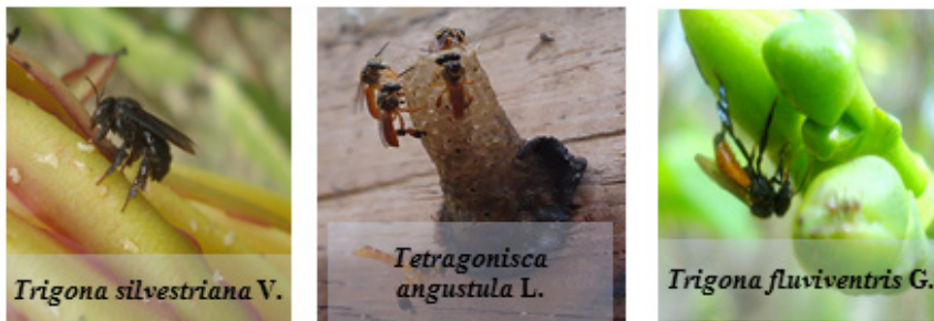
Figura 3. Abejas nativas identificadas en la zona de estudio.

Organización comunitaria. Díaz (2002) concibe la organización comunitaria como una estrategia para el desarrollo comunitario. A partir de esta definición nos referimos al trabajo de las organizaciones locales para mejorar las condiciones en la comunidad. Con esta finalidad se identificaron: cinco cooperativas agropecuarias, organizaciones políticas, instituciones del Estado, ONG, Universidades y gremios de productores destacando la UNAG que según los entrevistados tenían incidencia directa en las comunidades.