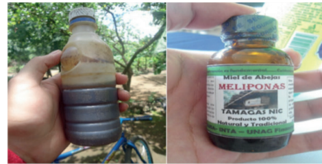
Figura 2. Presentación de miel sin agregado de valor y con agregado de valor en frasco de 35ml.

La meliponicultura aportó en ocho familias y redujeron los costos de inversión, aumentando el saldo de su margen bruto, cuatro familias presentaron resultados negativos a diferencia de los anteriores y sus costos de inversión aumentaron en concepto de adquisición de materiales para la fabricación de cajas, ubicando el aporte porcentual de margen bruto menor que cero, en los restantes dos productores que representan el 14% no realizaron inversiones, ni lograron multiplicar su meliponarios. Actualmente estos permanecen solamente con las colmenas que recibieron del proyecto.