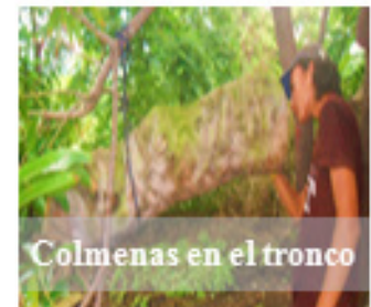
Figura 4. Tipos de colmenas