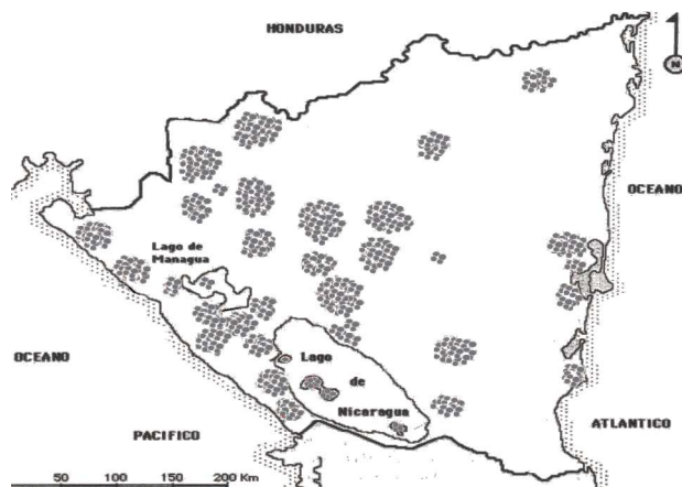
Imagen 3. Zonas con evidencias arqueológicas del periodo comprendido entre 500ac-800dc. Mapa elaborado sobre base de investigaciones recientes.

Implicítamente se está demostrando que existía una distancia considerable para obtener la materia prima, o bien el mismo intercambio facilitaba esto. También se ha dicho que existía intercambio con otros grupos dentro del territorio nacional, ejemplo, en el sitio los Placeres en Managua, la presencia de pedernal y jaspe se asocia a intercambio con la región de Chontales. (Lange y Sheets, 1983).