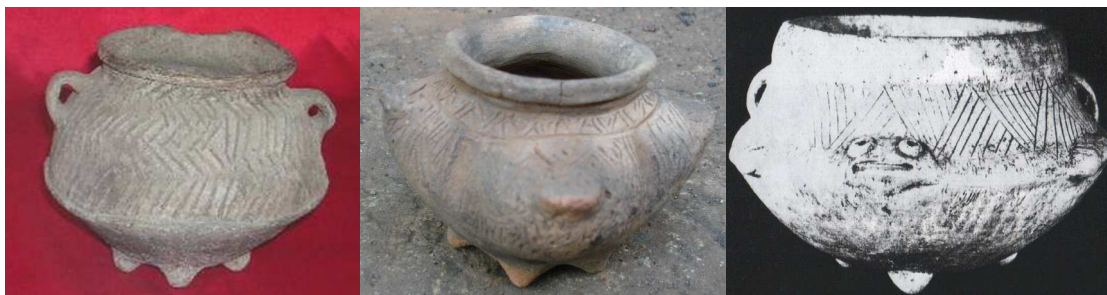
Imagen 1. Similitudes tecnológicas en la producción cerámica. Izquierda: pieza localizada en el museo de Condega, encontrada en la zona (Fuente Zambrana y Gámez, 2006; 10); al centro, pieza recuperada en el municipio de Kukra Hill, RAAS. Fuente: CADI; derecha: pieza de tipo Usulután (-200 a +550dc), referida por Claude F. Baudéz cuyo origen remite al municipio de León (Baudéz, 1976:41 y 243). El principio de decoración es similar en todas, (forma, soportes, incisos y apliques).

La presencia de esta tecnología cerámica denota claramente que la región norte de Nicaragua, estuvo poblada durante el período comprendido entre 300 al 1000 d.C, y tal parece que durante ese período, la región actualmente denominada La Segovia, formó parte de una red de intercambio bien estructurada con la actual Granada y otras poblaciones localizadas en la cuenca del lago de Managua. La presencia de este tipo cerámico en estas áreas, así lo indican. Por otra parte, la existencia de este mismo tipo de materiales en Acahualinca junto a materiales del período Bagaces (300-800 d.C), refuerzan esta hipótesis.