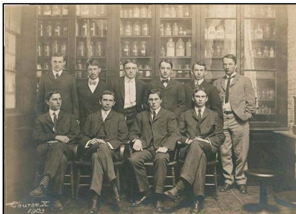
Curso X en 1903

El Curso X - Ingeniería Química era esencialmente Ingeniería Mecánica con algunos cursos de Química Industrial. El Curso X fue diseñado para satisfacer las necesidades de los estudiantes que desearan una enseñanza formal de Ingeniería Mecánica y simultáneamente dedicar parte de su tiempo al estudio de la aplicación de la Química a las artes de la Ingeniería especialmente con aquellos problemas que se relacionan con el uso y manufactura de productos químicos.