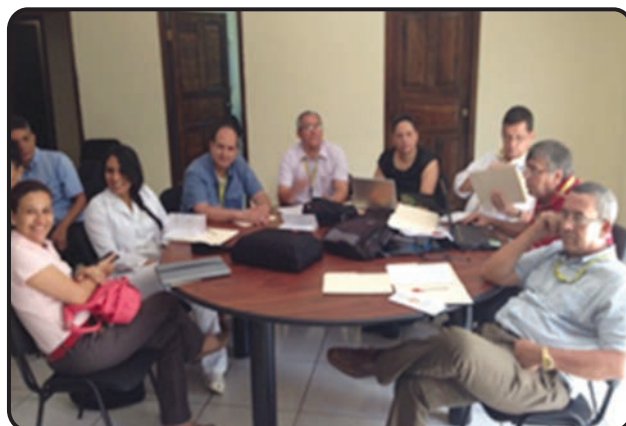
Figuras N°1, 2: Seminario Taller sobre Normas de Vancouver y Gestores Bibliográficos

Recibido: 16 de Noviembre 2,014 Aprobado 20 de Febrero 2,015