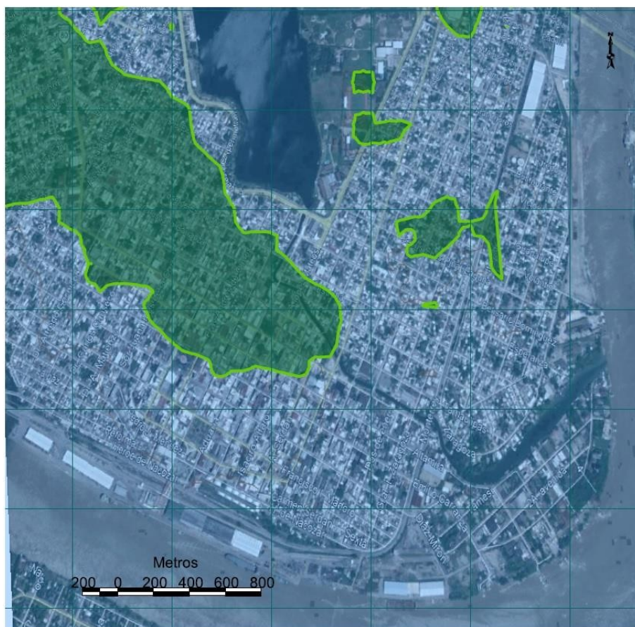
FIGURA 1. Principales zonas bajas del municipio de Tampico. Cálculos de los autores con base en datos proporcionados por Google Earth -SIO, NOAA, US Navy, NGA y GEBCO-