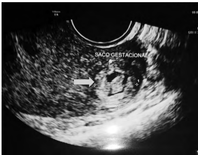
Figura 1. Saco gestacional irregular con botón embrionario sin latido cardíaco ubicado en miometrio posterior izquierdo (flecha azul).

de amenorrea de 7 semanas, se realizó prueba de embarazo con resultado positivo. Al examen físico, paciente se encontraba dentro de parámetros normales. Se realizó ultrasonido pélvico donde se observó endometrio lineal sin evidencia de saco gestacional. Se deja como impresión diagnóstica embarazo temprano y se cita en 2 semanas. Paciente retorna a las 2 semanas con historia de sangrado transvaginal leve de 2 días de evolución sin otro síntoma acompañante, se realizó especuloscopia donde se observa cérvix cerrado con escasos restos hemáticos, se realizó de nuevo ultrasonido pélvico donde se observó endometrio lineal sin ecos mixtos en su interior y sin presencia de saco gestacional en endometrio y anexos. No se observaron masas (miomas) ni líquido libre. Se dejó como impresión diagnóstica embarazo temprano versus aborto completo; se enviaron niveles de hormona gonadotropina coriónica humana fracción beta que reportó 600 UI/ml. dos días después se repite la prueba y reporta 5000 UI/l. Paciente inicia con dolor pélvico de moderada intensidad tipo cólico, acompañado de sangrado transvaginal. Se realizó un tercer ultrasonido pélvico (Figura 1)