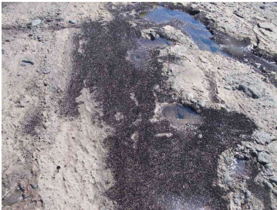
Fotografía 1: Franja de Brachidontes puntarenensis en área intermareal de plataforma rocosa, El Zonte.

La fauna bentónica que habita en la plataforma rocosa horizontal, está adaptada a condiciones de altas temperaturas y rocío marino durante la marea baja. En la pleamar, ocurre una intensa hidrodinámica que incide en esta área. En esa formación rocosa existen hendiduras (depresiones) con profundidades de 10-50 cm que retienen agua durante la bajamar, que permiten la colonización de ciertas especies, como Brachidontes puntarenensis (fotografía 1 y tabla 1). Este bivalvo fue registrado anteriormente en diferentes litorales rocosos en el país: Mizata, La Libertad, Jucuarán, Las Tunas (Barraza, 2014). Otras pozas más profundas (hasta 2.0 m en marea baja) se encuentran en grietas grandes que se han formado debajo de esta plataforma. La rugosidad, profundidad y corrientes, son elementos que inciden en la ocurrencia de especies; generalmente mientras más profundas, se incrementa la riqueza de especies de fauna. Las principales especies de macroinvertebrados que se observaron en las pozas intermareales se presentan en la tabla 1.