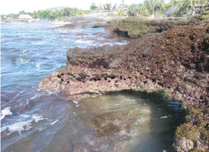
Fotografía 2. Pared vertical adyacente al océano expuesta en marea baja.

amenazada de extinción según el Listado oficial de especies amenazadas y en peligro de extinción (acuerdo N° 74 del Ministerio de Medio Ambiente y Recursos Naturales, 2015).