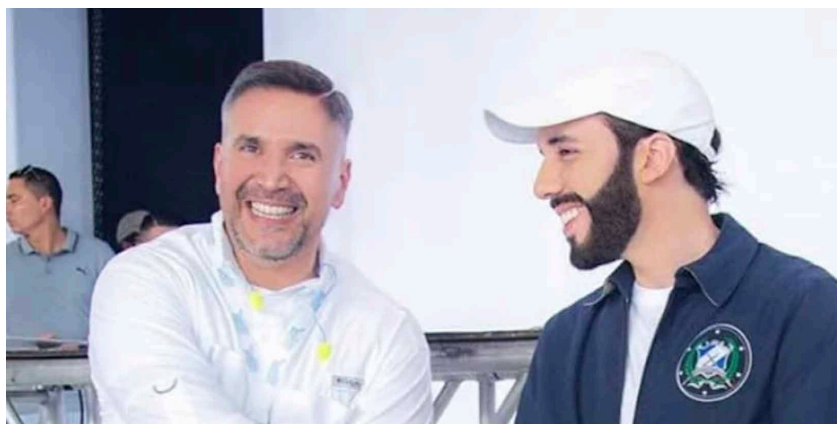
Foto de Edgar López Beltrán y Bukele cuando este último era alcalde de San Salvador.